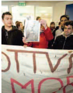
Morgunblaðið RAX Hæli Frá mótumálum í ráðuneytinu við brottvísun hælisleitanda 2009.

Í upphafi svar síns telur Persónuvernd það ekki hlutverk sitt að taka bindandi afstöðu fyrirfram til lögmatris birtingar einstakra úrskurða stjórnvalda. Þau verði sjálf að meta