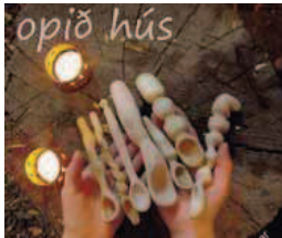
Waldorf Opið hús verður í Lækjarbotnum á morgun frá klukkan 13 til 16.