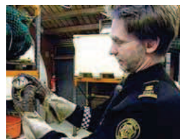
Björgun Lögregluáður með smyrlinn.

Þjóðfræðistofa og þjóðfræði við Háskóla Íslands, í samstarfi við Eddu-öndvegissetur, standa fyrir fjórða árlega Húmorþinginu á morgun, laugardag, á Hólmavík. Húmorþingio er bæði vetrarhátíð og málþing um húmor sem fræðilegt viðfangsefni. Á málþinginu munu fræðimenn koma fram og varpa ljósi á nýjustu rannsóknir og miðun á húmor. Í fyrirlestrum og umræðuhópum verður rætt um hinar ýmsu birtingarmyndir húmors og margvíslega iðkun þess í daglegu lífi og fjölmiðlum.